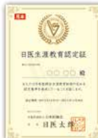
日医生涯教育認定証