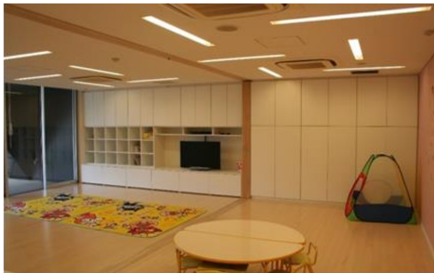
メディッコクラブ（熊本市医師会保育所）利用状況