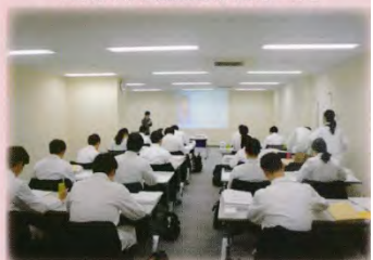
和歌山県立医科大学附属病院研修医センターにて