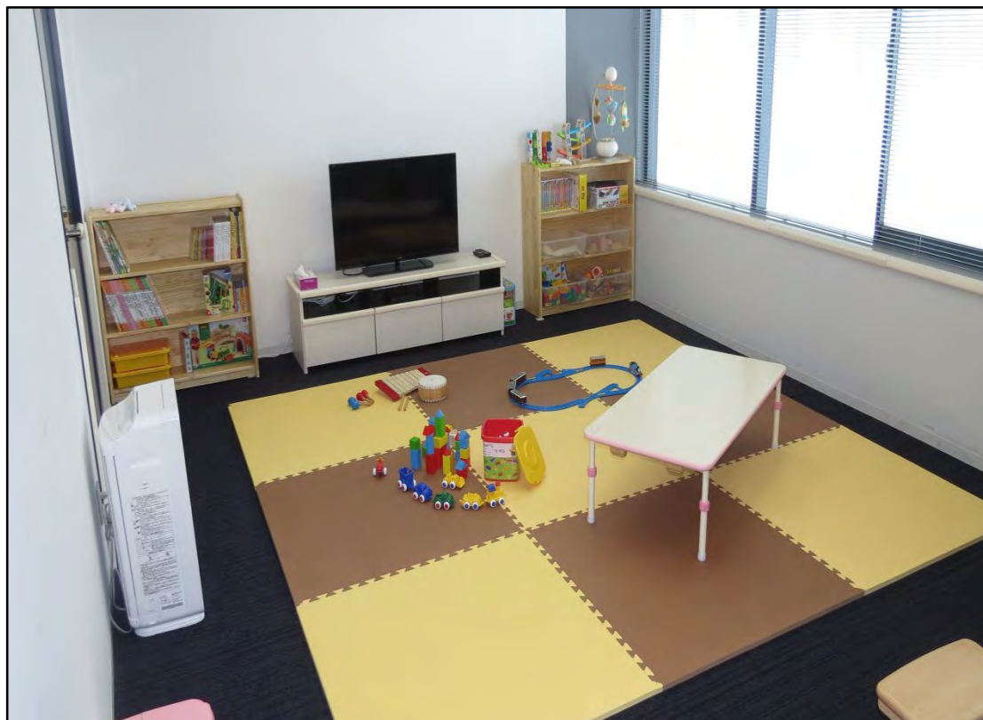
府医キッズルームの様子