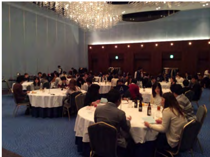
昨年のパーティーの様子