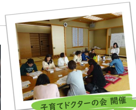
子育てドクターの会 開催