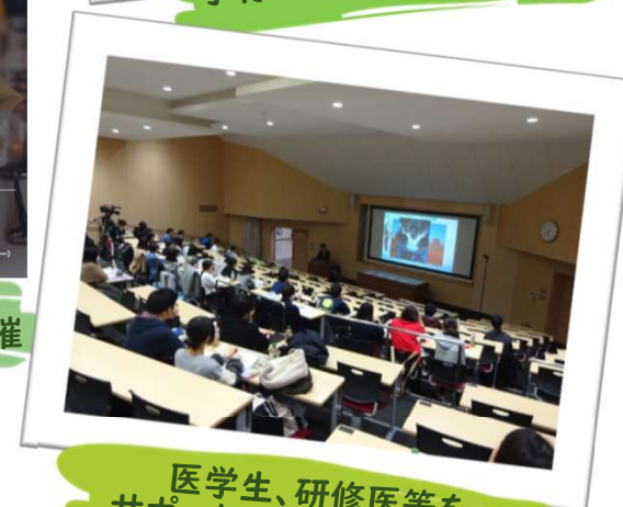
医学生、研修医等を サポートするための会 開催