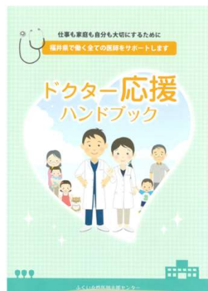
ハンドブック作成