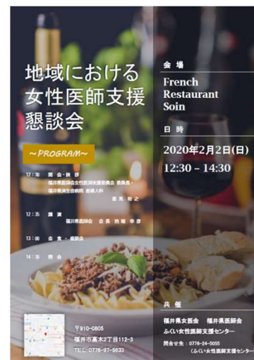
地域における 女性医師支援懇談会 開催